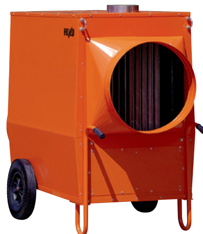
K 120 Für Vermietprofis