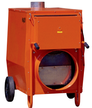
K 50 Der Universelle