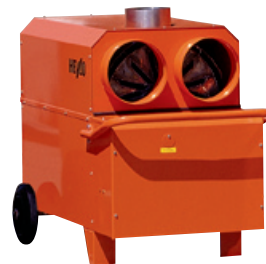
K 25 T Der Kompakte

HEYLO K-Geräte setzen den Standard für mobile Heiztechnik und bewähren sich seit Jahren im harten Einsatz auf Baustellen und Veranstaltungen. Das Original HEYLO-ISK-Brenner-Konzept schützt alle Brenner- und Schaltelemente und steht für Bedien- und Wartungsfreundlichkeit. Die HEYLO Ölvorwärmung sorgt für einwandfreien Betrieb – auch bei niedrigen Temperaturen. Heylo K-Geräte stehen für Zuverlässigkeit und Effizienz.